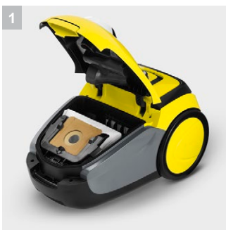
1 Удобная система фильтрации с фильтр-мешками

Идеальное решение для уборки квартир и небольших домов: Просто в обращении компактный мешковой пылесос Керхер VC 2.