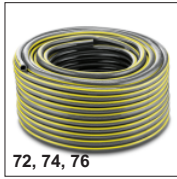
72, 74, 76