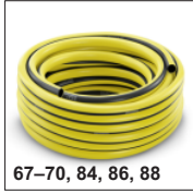
67-70, 84, 86, 88