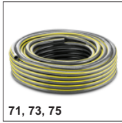
71, 73, 75